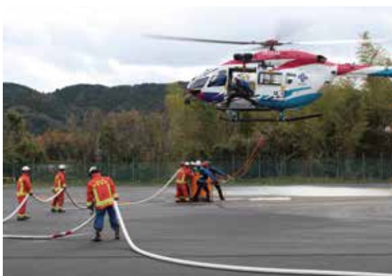
防災航空隊合同訓練