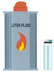
ライター・オイル