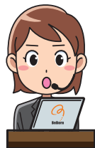
多言語コールセンター (民間業者)