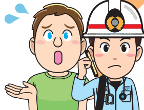
外国の方 救急隊員